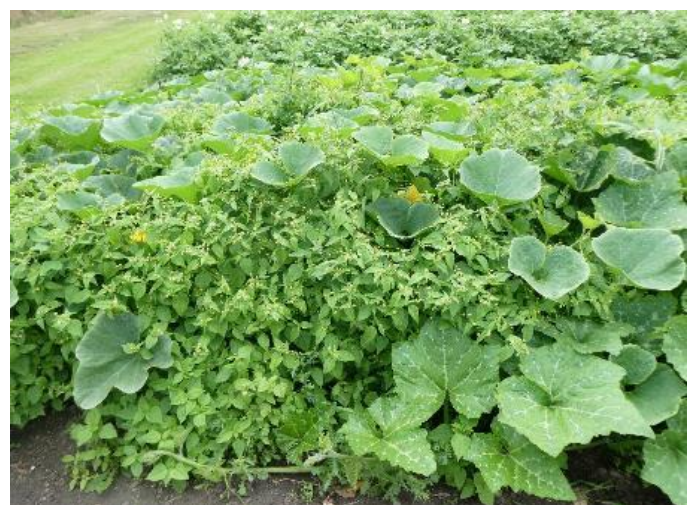
Kürbisbestand im Juli 2020 nicht gemulcht, starker Aufwuchs von Franzosenkraut