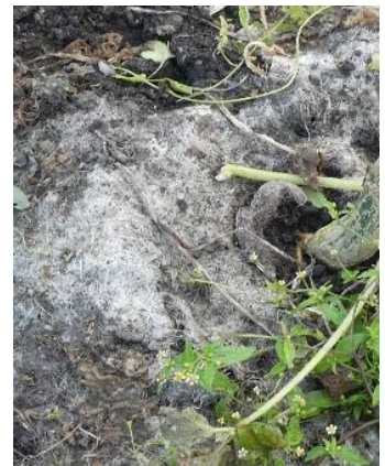
Zustand des abbaubaren Mulchmaterials fünf Monate nach dem Einbau im Rahmen der Kürbisanzucht, links - Folie, mittig - Schafwolle, rechts - Hanfvlies

Zusammenfassend konnte ein positiver Effekt auf die Pflanzen und den Ertrag durch Verwendung von abbaubaren Mulchmaterialien festgestellt werden.