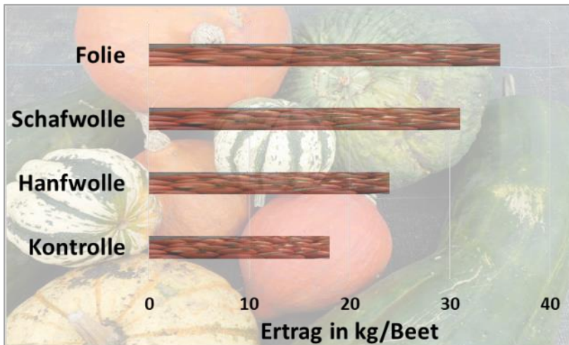
Wirkung von biologisch abbaubaren Mulchmaterialien auf die Ertragsentwicklung von Kürbisarten nach fünf Monaten Kulturzeit im Pflanzenschutzamt Berlin, 2020

c) Der Gesamtertrag an Kürbis je Beet ist auffallend unterschiedlich. In der Grafik ist erkennbar, dass sich durch die Folie der Ertrag nahezu verdoppelte. Ursache dafür ist u.a. das Fehlen von Konkurrenzbesatz an Wildkräutern und die optimale Nährstoff- und Wasserverfügbarkeit unter der schwarzen Folie für die wärmeliebenden Kürbispflanzen. Durch die Schaf- und Hanfwolle wurde ebenso ein positiver Effekt erreicht. Hier muss allerdings berücksichtigt werden, dass diese Materialien im Rahmen der Zersetzung v.a. Stickstoff binden, der dann erst im Folgejahr pflanzenverfügbar sein wird.