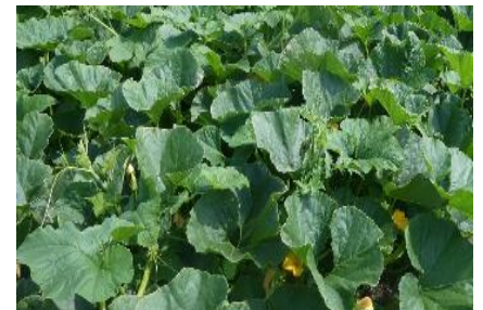
Versuchsanlage mit unterschiedlichen abbaubaren Mulchmaterialien: Bild links, unten links - abbaubare Mulchfolie, oben links - Saisonmulchmatte Schafwolle, rechts unten - Hanfland-Unkrautvlies; Bild mittig und rechts - gleichmäßige Entwicklung des Bestandes im Juni und Juli 2020.