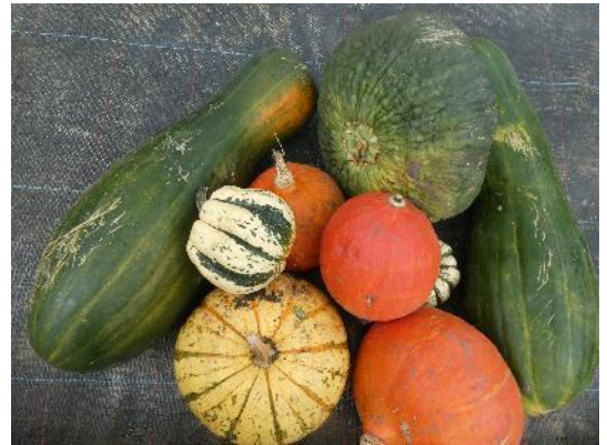
Verwendete essbare Kürbis-Arten - Hokkaido, Marina di Chioggia, Sweet Dumpling, Futsu Black und Longue de Nice

Eine der gezielten Maßnahmen ist es, die Verdunstung durch die Bodenoberfläche durch gezieltes Mulchen oder durch Folienabdeckung zu reduzieren. In diesem Zusammenhang wurden im Pflanzenschutzamt Berlin unterschiedliche Mulchmaterialien wie 1. Saisonmulchmatte Schafschurwolle, 2. Hanfland-Unkrautvlies 3 mm, 3. biologisch abbaubare Mulchfolie im Vergleich zum offenen Boden eingebaut und jeweils mit den essbaren Kürbissorten Hokkaido, Marina di Chioggia, Sweet Dumpling, Futsu Black, Longue de Nice bepflanzt. Alle Beete waren gleich groß und mit der gleichen Anzahl an Kürbispflanzen bepflanzt. Auch die durchgeführten Kulturmaßnahmen waren identisch.